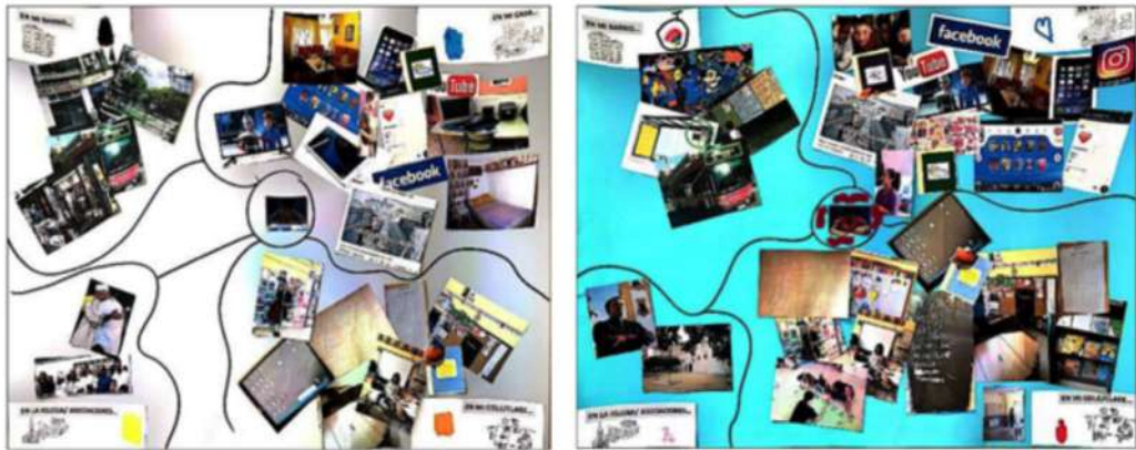
Figura 2. Mapping de Asim (15/06/2018) y Sofía (20/06/2018)

e interpretaron asociando cada espacio con un olor, un sabor, un color y un sonido musical relacionado con sus identidades culturales.