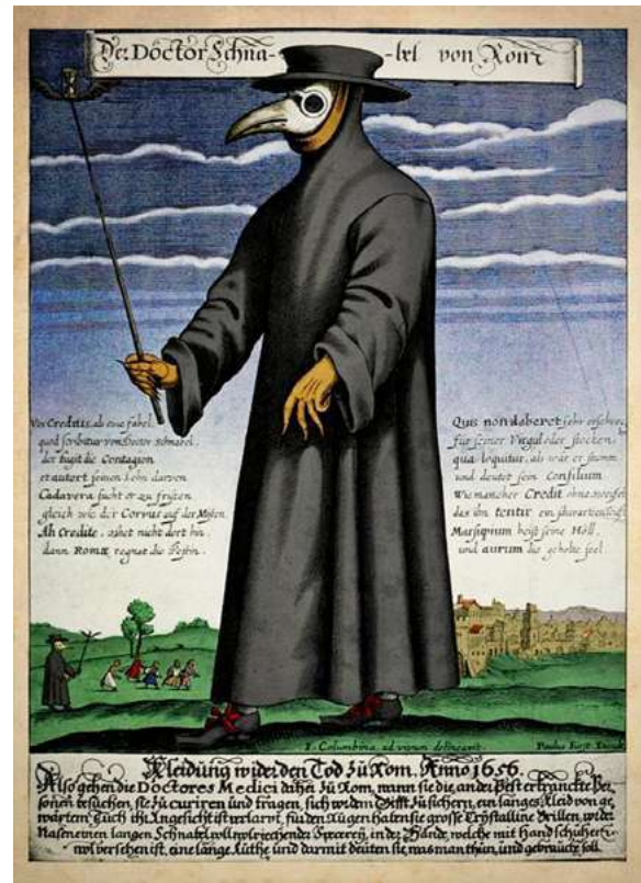
Grabado en color del Doctor Schnabel [Dr. Beak], un médico en la peste en Roma, publicado por Paul Fürst, ca. 1656.

A partir de un mismo episodio histórico, pueden verse dos actitudes totalmente distintas: el diario de Pepys es un muestrario de descarnada picardía y pragmatismo que, a la vez que expresa un enorme miedo a la pandemia, muestra un extremado ingenio para continuar divirtiéndose y obtener ganancias monetarias sin que haya, en ningún momento, un sentimiento de identificación o empatía con el sufrimiento de los demás. En contraste, el narrador de Defoe, sin incurrir en actos heroicos, muestra su azoro y preocupación por el fenómeno de contagio y sus devastadores efectos sociales, observa los comporta-