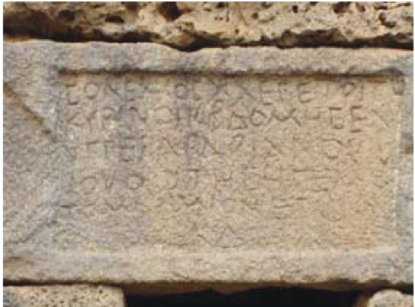
Lajat cifra sus esperanzas en el desarrollo del turismo cultural.