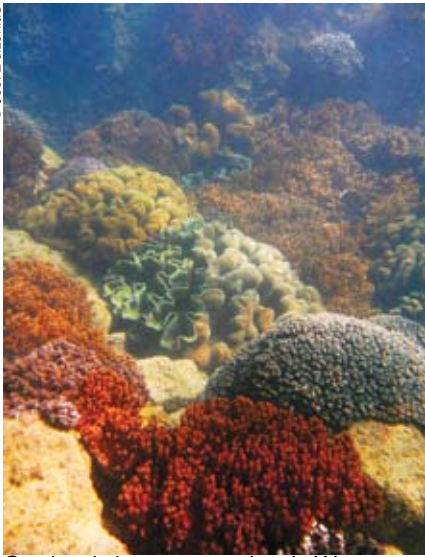
Corales de la reserva marina de Woongarra, situada en el parque marino de Great Sandy (Australia).

La noción de reserva de biosfera surgió en 1974, en el marco del Programa sobre el Hombre y la Biosfera (MAB) de la UNESCO, y la Red Mundial de Reservas de Biosfera se creó dos años más tarde. En el decenio de 1970 esa noción correspondía grosso modo a la de “zona protegida”, pero en el decenio siguiente fue englobando paulatinamente la idea de desarrollo sostenible. Hoy en día, al considerarse que las poblaciones humanas forman parte de la biosfera, el concepto de reserva de biosfera se centra más en la conservación y la educación científica con miras a promover una interacción beneficiosa de las sociedades humanas con su entorno.