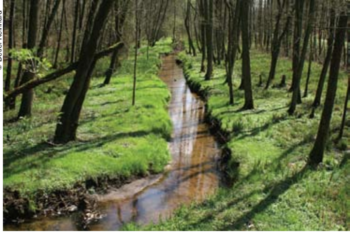
Un sector de la zona núcleo de la reserva de biosfera de Bliesgau (Alemania).

La noción de ecología urbana es fundamental en Bliesgau, una zona protegida de Alemania que se ha sumado el 26 de mayo a la Red Mundial de Reservas de Biosfera de la UNESCO. Bliesgau no es el primer sitio de la Red que comprende áreas urbanas, pero sí es el único con una densidad de población de 310 habitantes por kilómetro cuadrado.