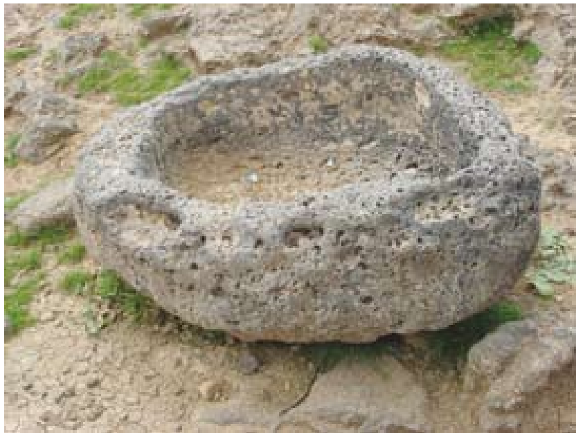
En Lajat se han localizado hasta la fecha unos 700 sitios históricos y arqueológicos.