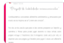
loteria del corazon.pdf PDF