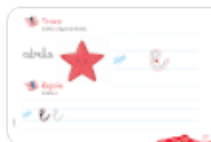
P. 27 DE.png Imagen